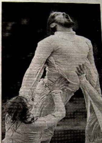
Danseurs primitifs et aquatiques.

Le concept utilisé est très innovant. Cependant, il offre apparemment peu de